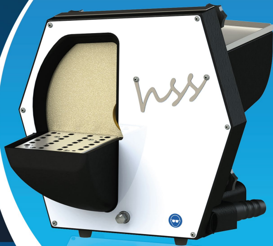
Abb.: HSS-88 mit Diamantschleifscheibe